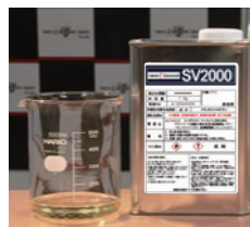
▲黄金色がかった透明